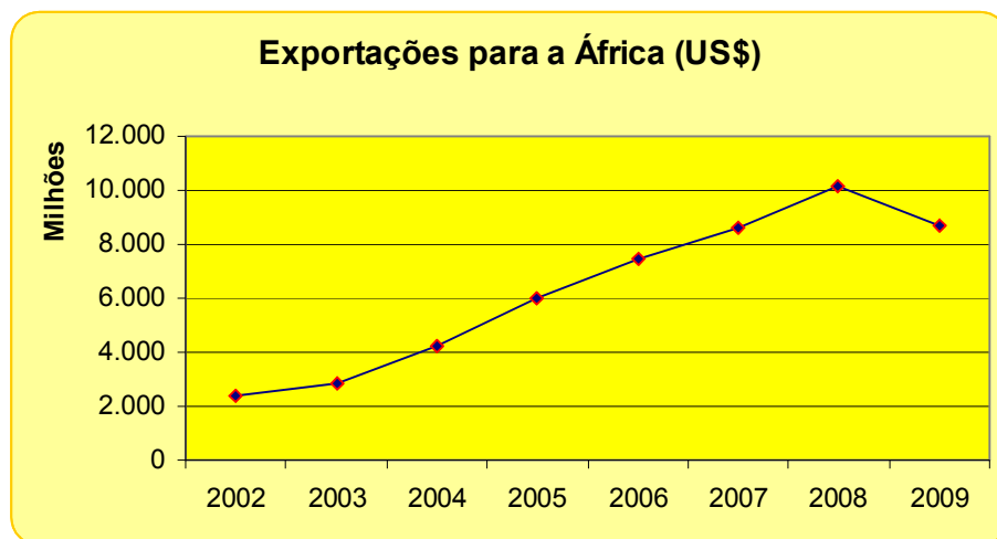
Gráfico 1 – Exportações brasileiras para países da África – consolidadas